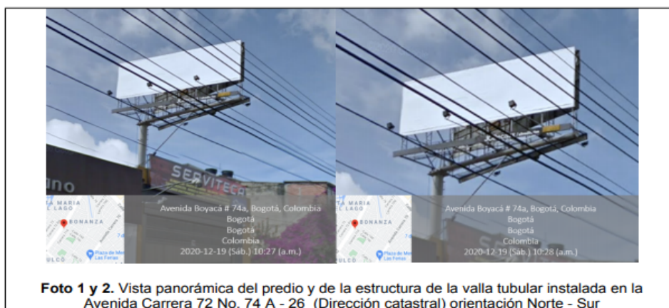
Foto 1 y 2. Vista panorámica del predio y de la estructura de la valla tubular instalada en la Avenida Carrera 72 No. 74 A - 26 (Dirección catastral) orientación Norte - Sur